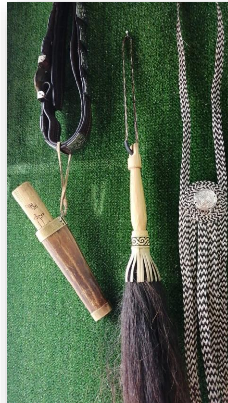
Мужской пояс с якутским ножом