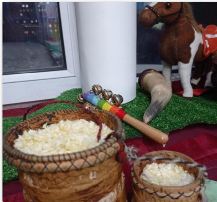
Берестяная утварь с молочной продукцией