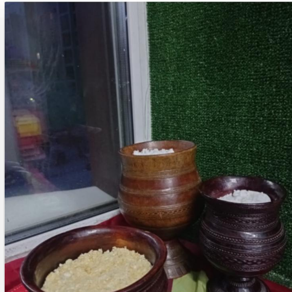
Чороны с кумысом и кытыйа с саламатом (Все молочные продукты сделаны из наполнителя чистых пеленок)