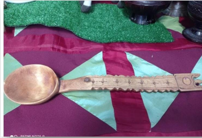
Хамыях из березовой капы