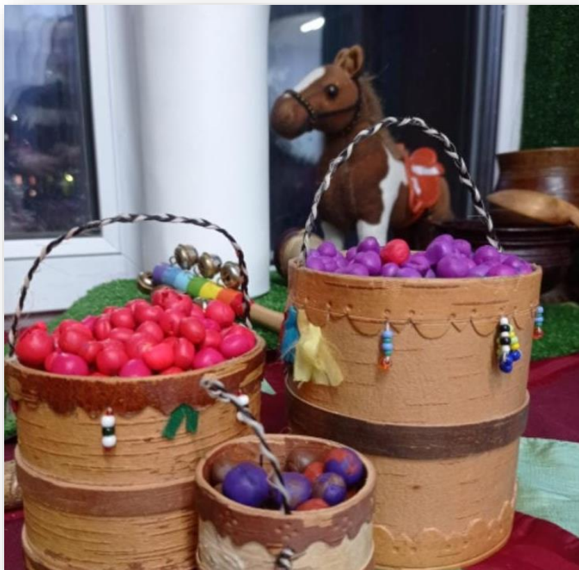
Дары наших лесов, сделанные из пластилина самими детьми