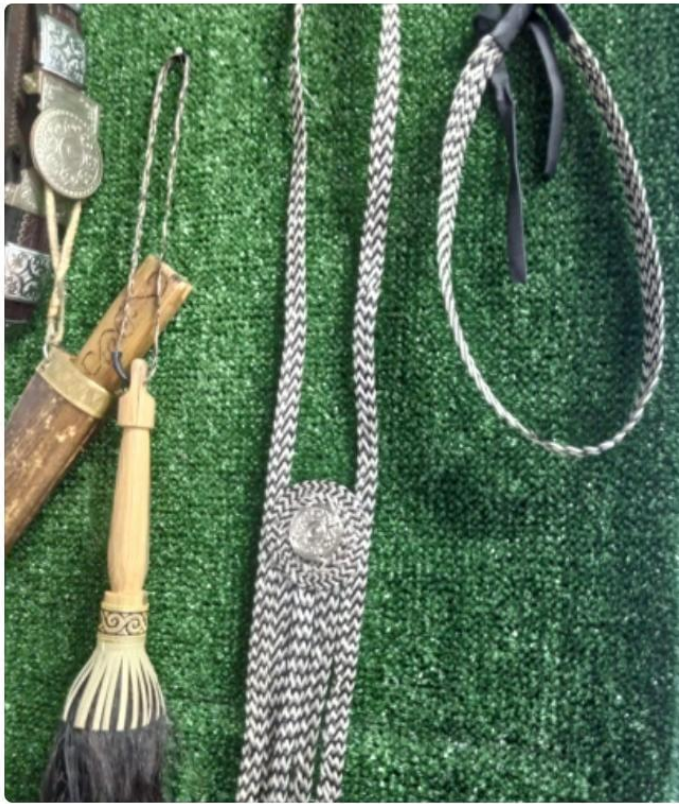
Нагрудное и налобное украшение, сплетенное из конской гривы