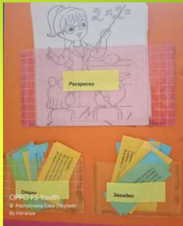
Раскраски Стихи загадки