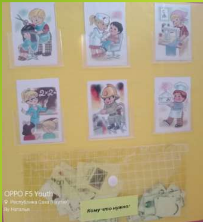
Д/И «Кому что нужно»