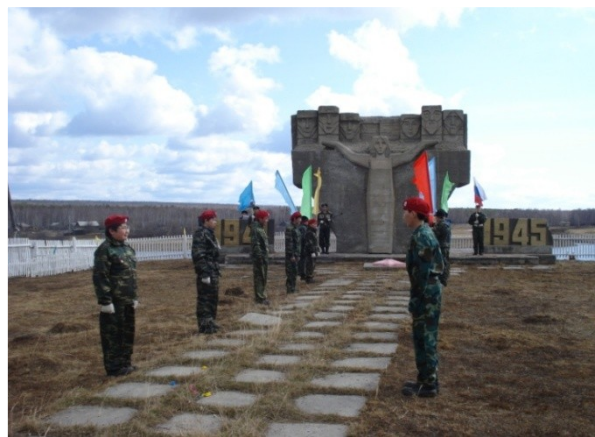
Установки у мемориала победы.

Это священное место в Синске. На этом месте в 1815 году была возведена Воскресенская церковь. Это был центр, куда с окрестных деревень собирались люди на престольные праздники. В советское время, в 1984 году, церковь снесли, через 5 лет построили мемориал Победы.