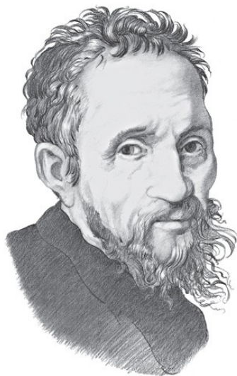
Микеланджело Буонарроти 1475—1564

Само слово « СНЕГОВИК » изначально появилось в немецком языке.