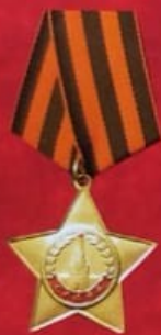
Орден Славы первой степени (16.04.1945)

служил в легендарном моторизованном батальоне автоматчиков 65-й танковой Волновахской Краснознамённой орденов Суворова и Кутузова бригады в составе 11-го танкового корпуса