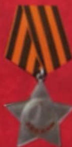
Орден Славы третьей степени (20.07.1944)