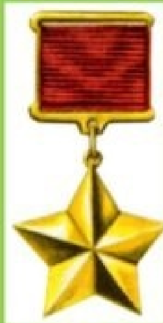
ГЕРОЕВ СОВЕТСКОГО СОЮЗА