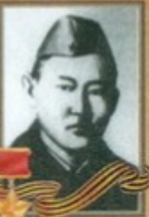
ЛАБКОВСКИЙ Пётр Кириллович