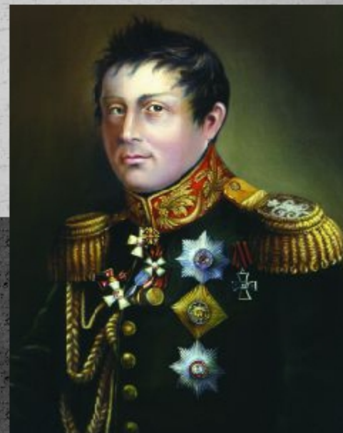
Иван Иванович Дибич- Забалкан ский