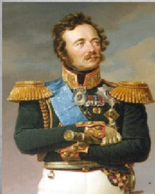
Ива́н Фёдорович Паске́вич – Эриванский