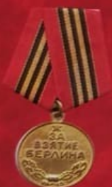
"за взятие Берлина" (02.05.1945)