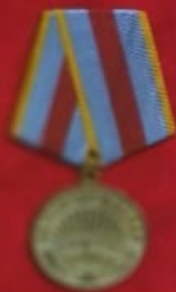
"за освобождение Берлина" (17.04.1945)