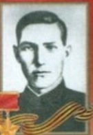
КРАСОВСКИЙ Алексей Константинович