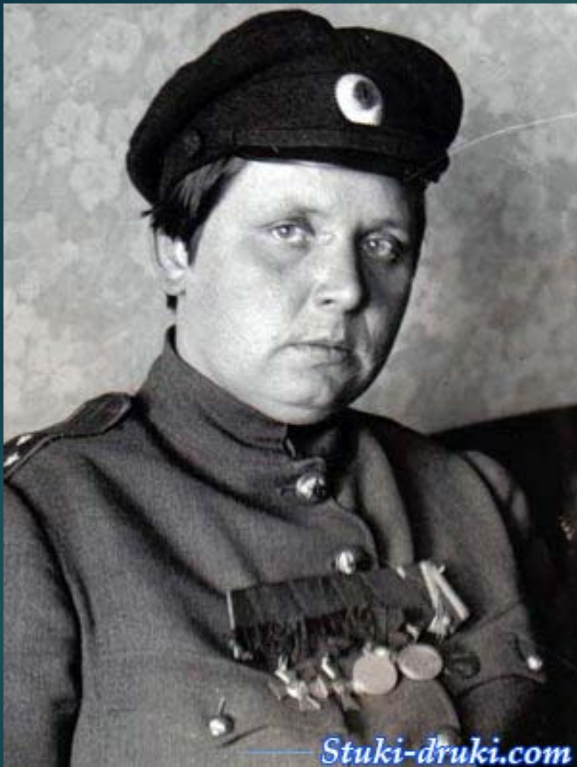
Мария Леонтьевна Бочкарёва- единственная женщина, полный кавалер Ордена Святого Георгия

В ноябре 1914 года на призывной пункт города Томска пришла женщина. Высокая, крепкая, с решительным взглядом. «Хочу идти на фронт», — сказала она офицеру, принимавшему новобранцев. Военный указал на стол в противоположном углу зала. Там записывали в санитарный батальон. Но женщина отрицательно покачала головой: «Я воевать буду. Запишите рядовым». Тщетно офицер объяснял, что женщина в армии может быть только сестрой милосердия, но никак не солдатом. Необычная посетительница упорно настаивала на своём. «Тогда обращайтесь к царю. Если он разрешит вам служить — приходите», — с усмешкой сказал военный. Вряд ли он предполагал, что женщина последует его совету. Однако, выйдя из призывного пункта, та прямоком отправилась на почту. На последние деньги она отправила телеграмму императору Николаю II — с просьбой разрешить ей, крестьянке Марии Леонтьевне Бочкарёвой , поступить на военную службу.