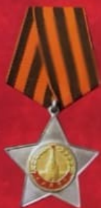
Орден Славы второй степени (02.02.1945)