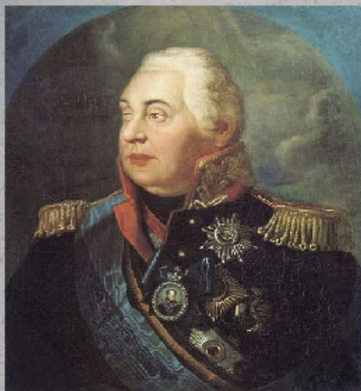
Михаи́л Илларио́нович Голени́щев- Куту́зов - Смоленский