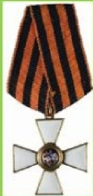
КАВАЛЕРОВ ОРДЕНА СВЯТОГО ГЕОРГИЯ