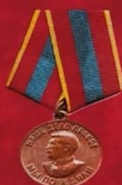
"за доблестный труд в ВОВ" (1941-1945)