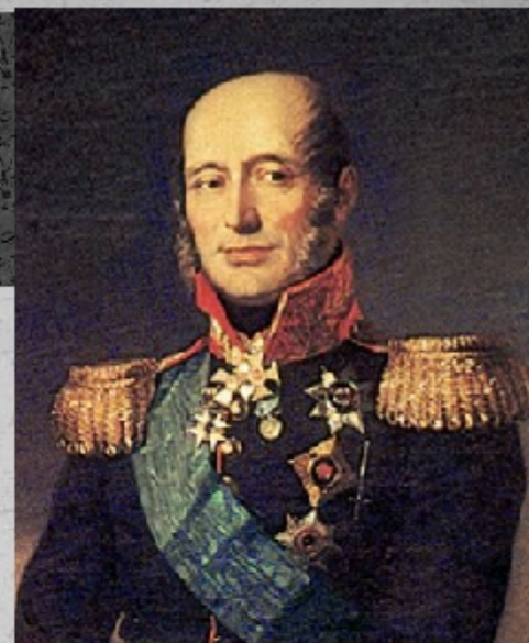
Михаи́л Богда́нович Баркла́й- де-То́лли