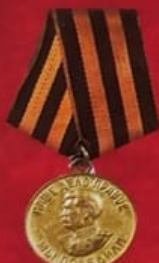
"за победу над Германией" (1941-1945)