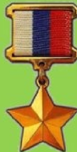
ГЕРОЕВ РОССИЙСКОЙ ФЕДЕРАЦИИ

9 декабря в России ежегодно отмечают День Героев Отечества в России . Эта памятная дата установлена Федеральным законом от 28 февраля 2007 года (№22-ФЗ) и утверждена Президентом РФ В.В. Путиным.