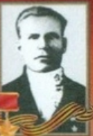
КРАСОВСКИЙ Григорий Дмитриевич