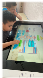
Использование интерактивного стола