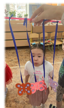
Изготовление вместе с детьми разные атрибуты для работы над правильным дыханием