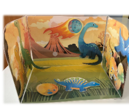
Использование в кружковой работе разные игры на липучках