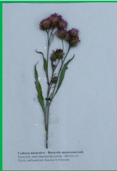
Сьыьы наслгьга – Василгьк шьроховатый. Хоньута, тьаь саьдгылар ууьр. Ёьтггх от. Отун, сьбьаьтггн бьаькьа тутталлар.