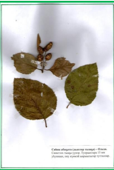
Синк абадга (аьхтар талар) – Оьхьа. Синкггх тьаьра ууьр. Туорахтара 15 мм уьуннаах, ону кьумгьй марьыгыр тутталлар.