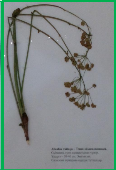
Абаьы тьаьра – Тьин обьаькьоньыьы. Сьыьыга, сьыьы кьыпгьтггн ууьр. Урауь – 30-40 см. Ёьтггх от. Сььмггн пририва кьурьа тутталлар.