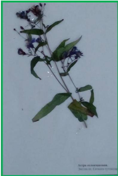
Аьтра обьаькьоньыьы. Ёьтггх от. Сььмггн пририва кьурьа тутталлар.