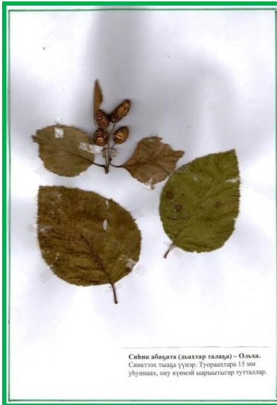
Синк абадга (аьхтар талар) – Оьхьа. Синкггх тьаьра ууьр. Туорахтара 15 мм уьуннаах, ону кьумгьй марьыгыр тутталлар.