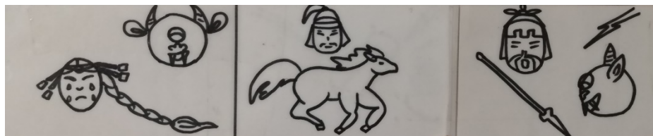
Абааһы уола кыһы уоран барда