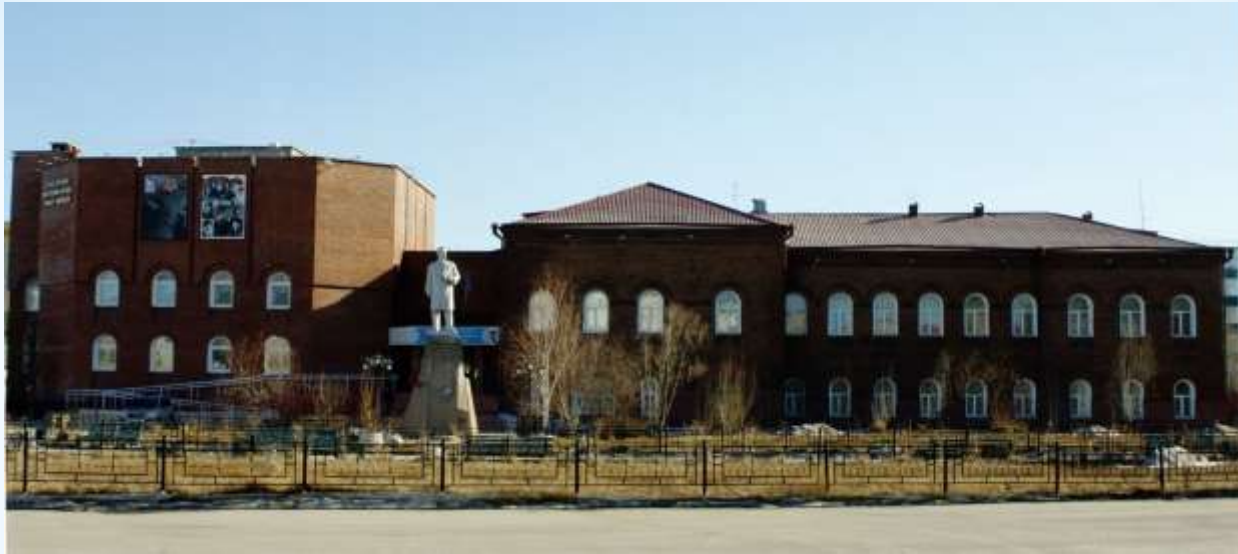
Якутский государственный объединенный музей истории и культуры народов Севера им.Е.Ярославского