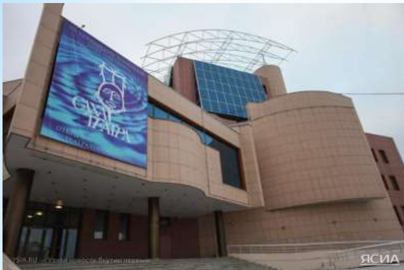
Саха академический театр им.П.А.Ойунского