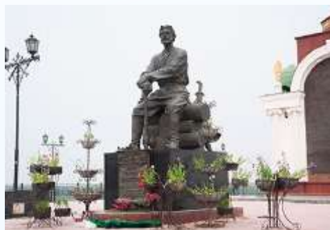
Памятник Петру Бекетову