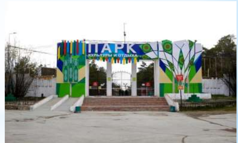
Парк культуры и отдыха