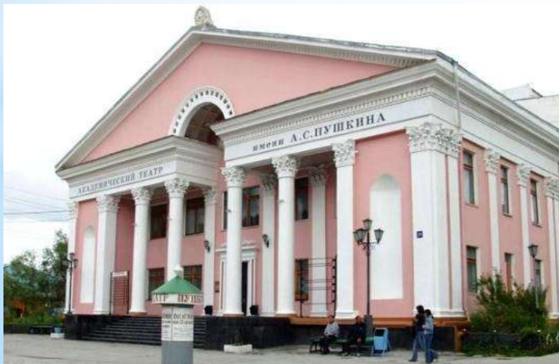
Якутский русский драматический театр им.А.С.Пушкина