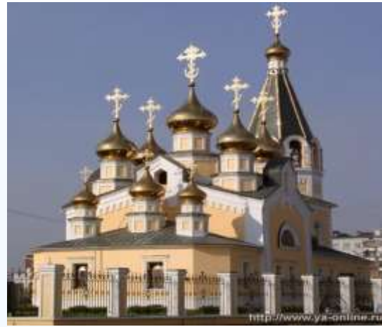
Спасо-Преображенский градомякутский кафедральный собор