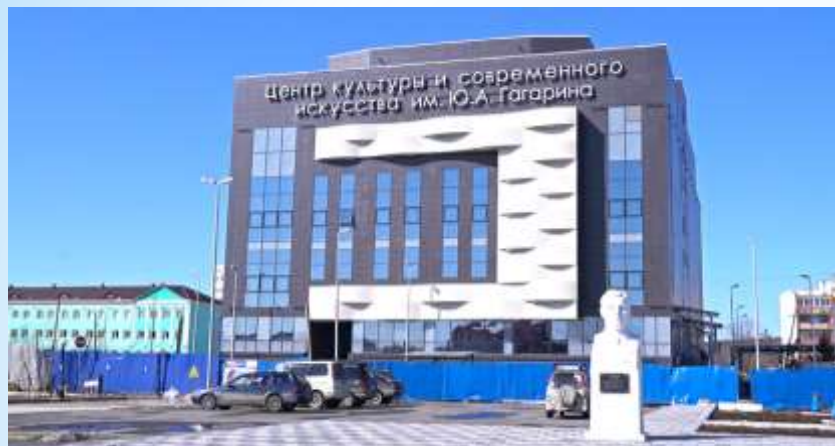
Центр культуры и современного искусства им.Ю.А.Гагарина