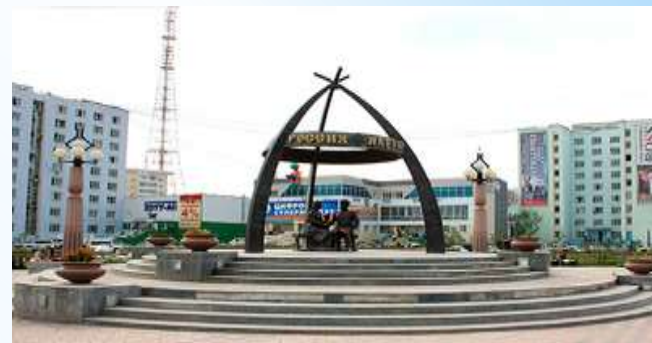
Памятник Дежневу Семену Ивановичу, Абакаюде