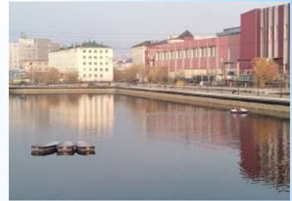
Набережная Талого озера