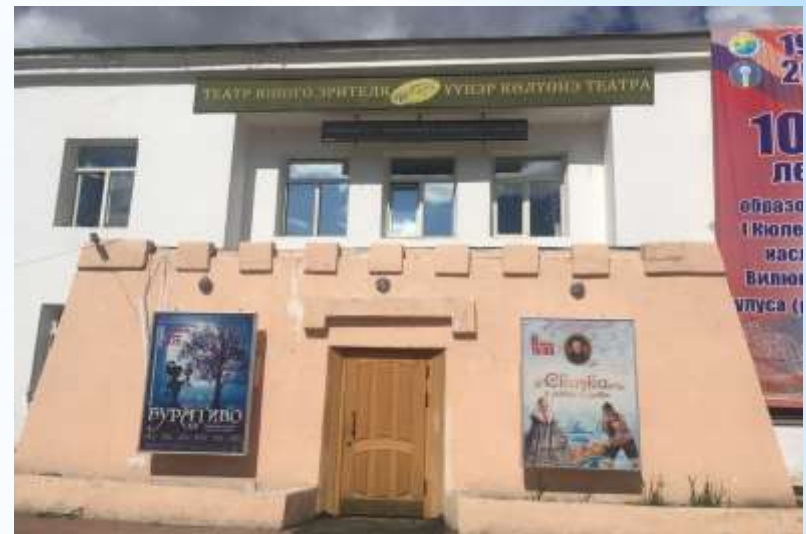
Театр юного зрителя