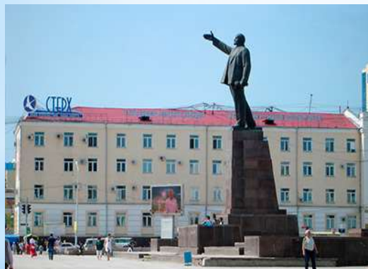
Памятник Владимиру Ильичу Ленину