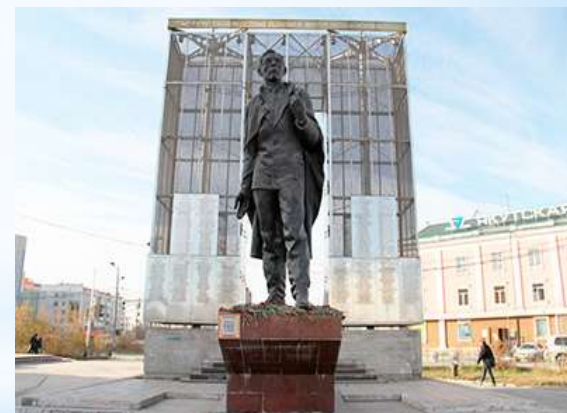
Памятник Ойунскому Платону Алексеевичу