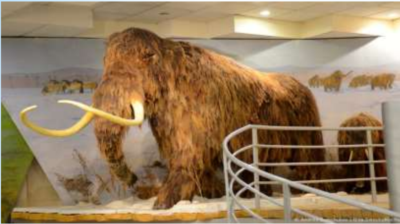
Музей мамонта в Якутске