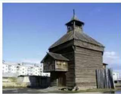
Башня Якутского острога