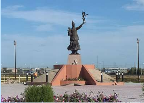
Памятник Матери (сквер матери)