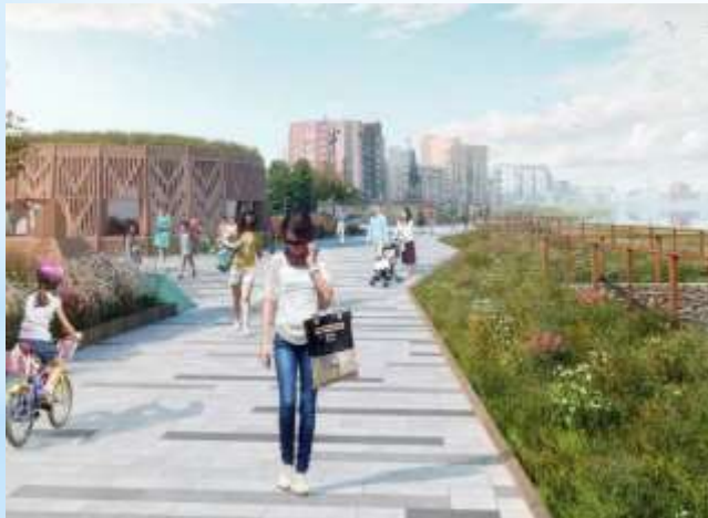
Набережная озера Сайсары