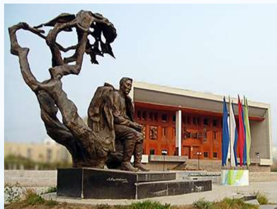
Памятник Кулаковскому Алексею Елисеевичу