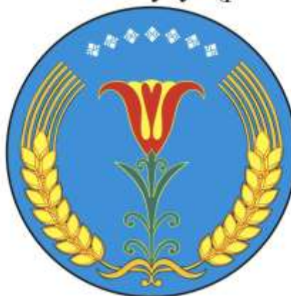
Амгинский улус (район)