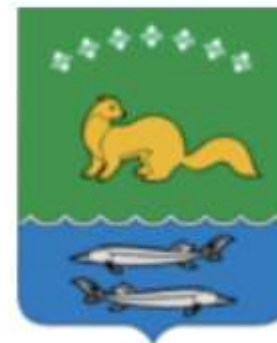
Жиганский улус (район)