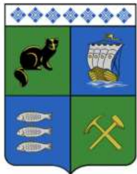
Верхнеколымский улус (район)