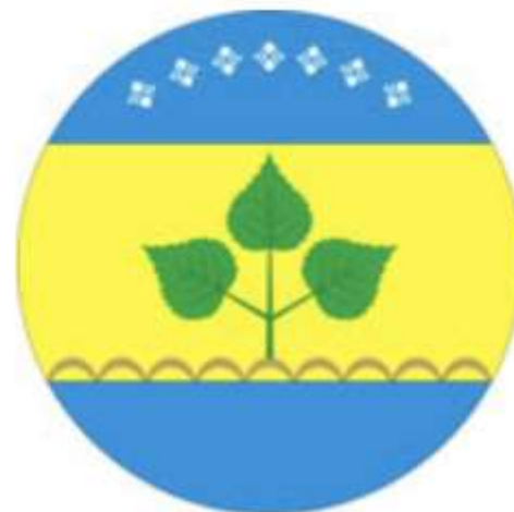
Чурапчинский улус (район)