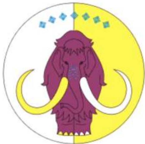
Усть-Янский улус (район)