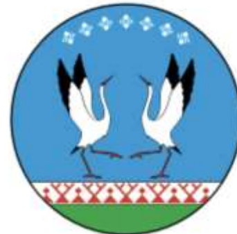
Момский улус (район)