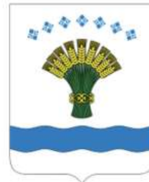
Олекминский улус (район)