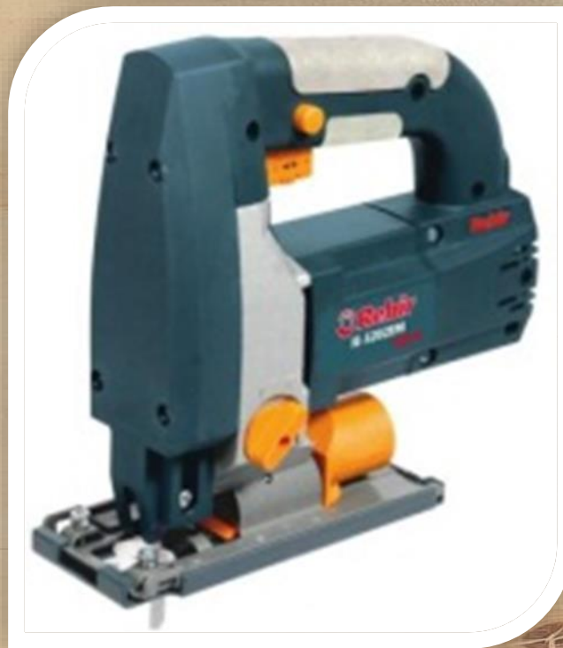
Электроробзик IE- 5202 EM