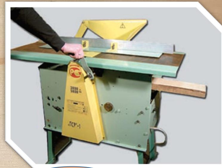
Станок универсальный деревообрабатывающ ий « ДОС-280 ПСР »