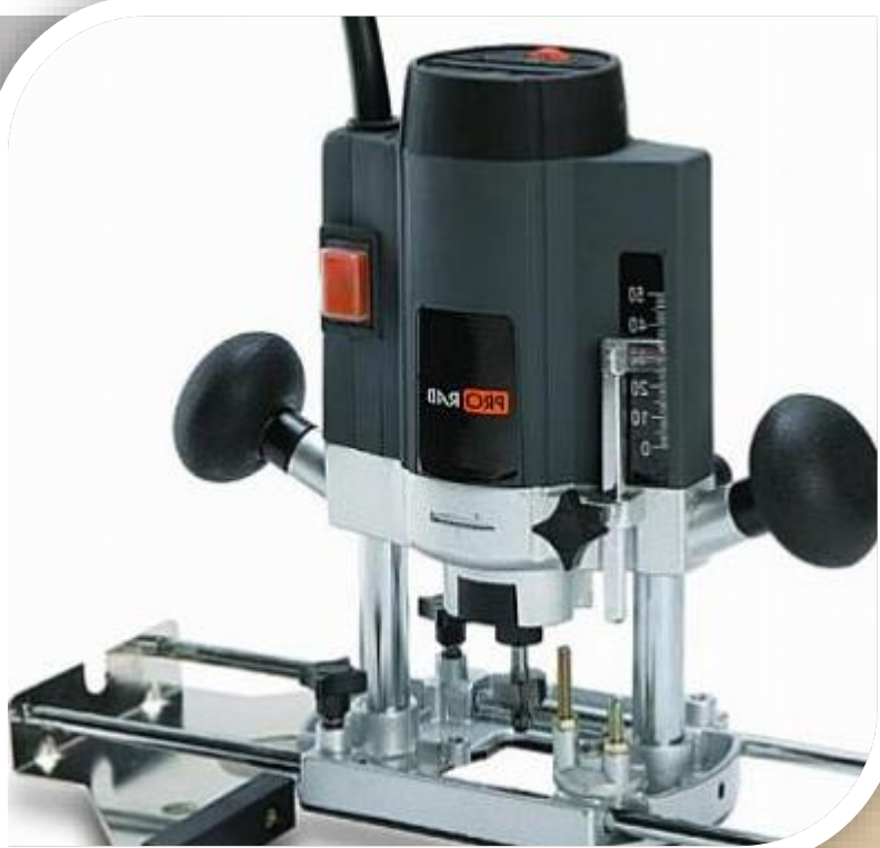
Фрезер электрический PRORAB