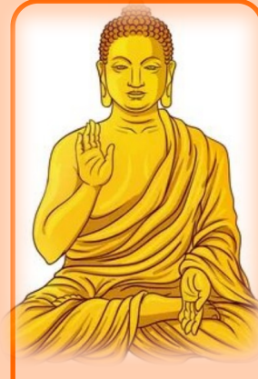
Сиддхартха Гаутама (623—544 гг. до н. э.) или Будда, что значит «просветлённый высшим знанием».

Напиши насколько материал тебе понятен, есть ли вопросы.