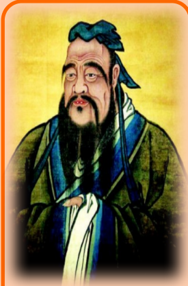
Конфуций (551—479 гг. до н. э.) древний мыслитель и философ Китая