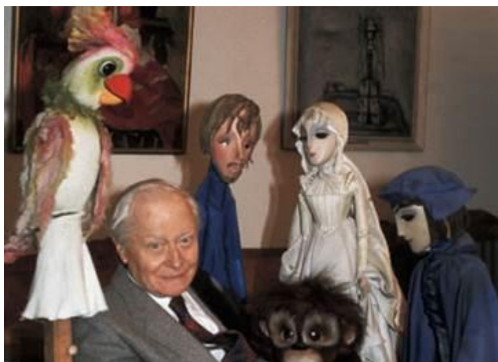
СЕРГЕЙ ВЛАДИМИРОВИЧ ОБРАЗЦОВ (1901—1992)

Одним из самых известных кукольных театров России является Государственный Академический Центральный театр кукол им. С. В. Образцова. Он был организован в 1931 году (Центральный театр кукол). Большую часть спектаклей поставил С. В. Образцов, который с 1949 был директором театра. В 1937 году при театре был создан Музей театральных кукол, коллекция которого считается одной из лучших в мире.