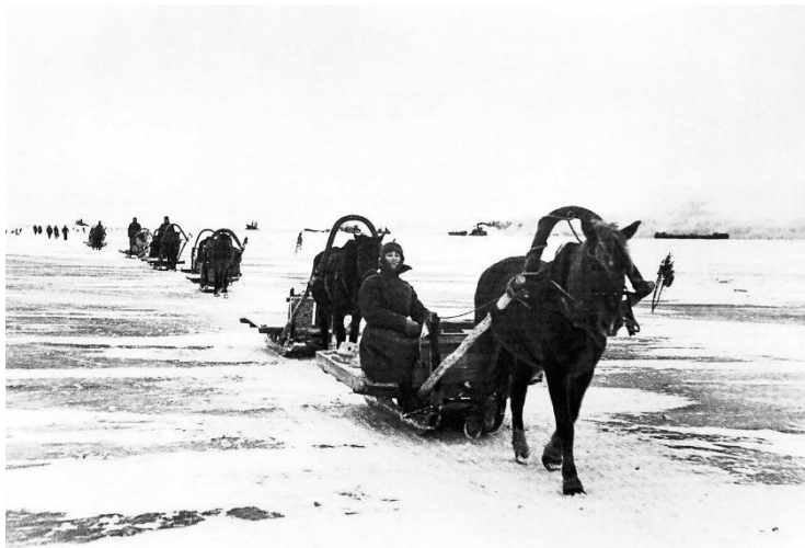
бомбежками, поэтому дорогу по Ладожскому озеру сначала прозвали «Дорогой смерти»