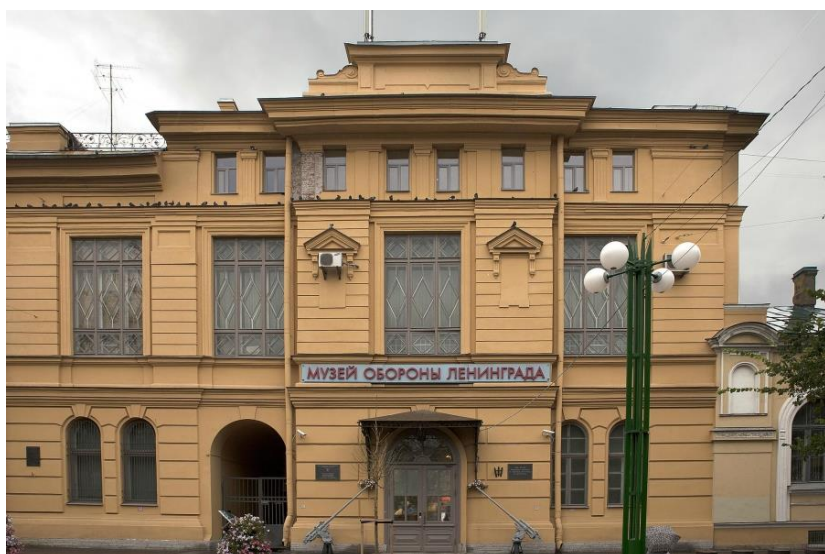
9 слайд Государственный мемориальный музей обороны и блокады Ленинграда.