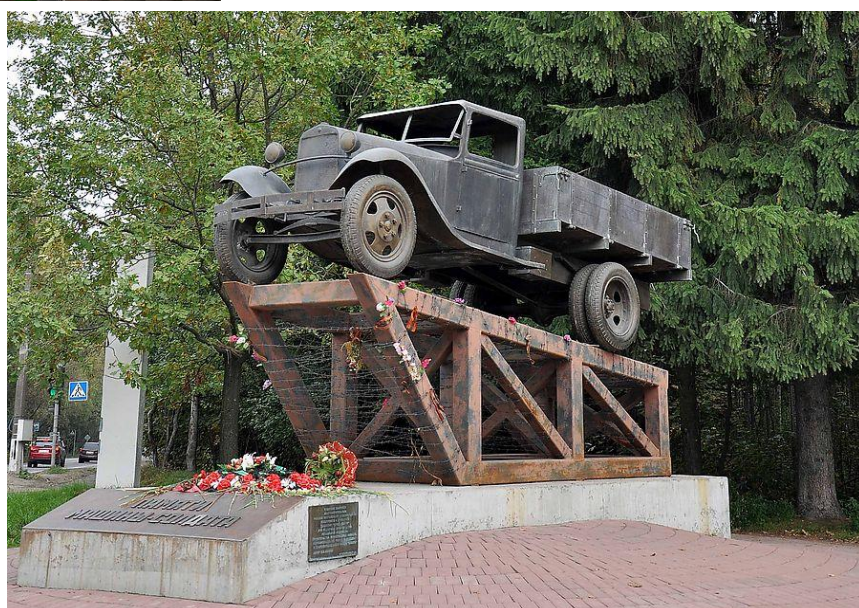
10 слайд «Памятник, установленный полуторке» во Всеволожске.