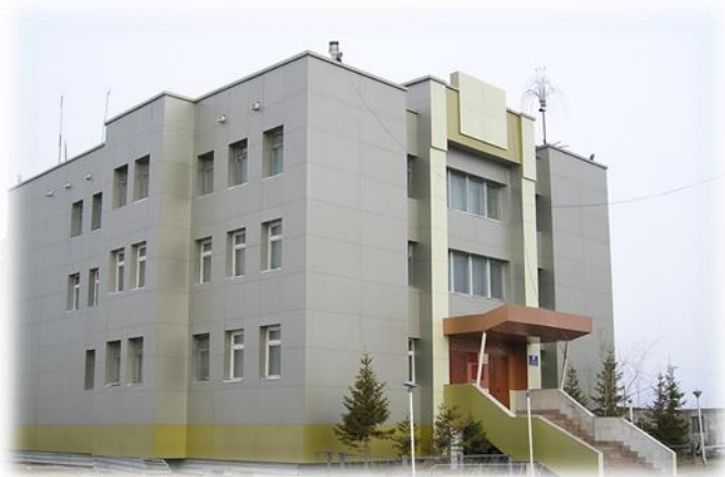
Администрация города Нюрба