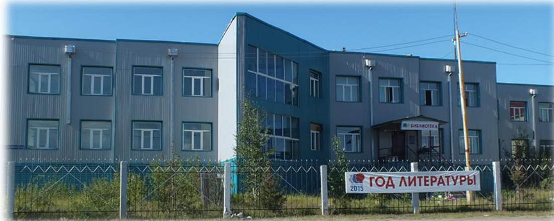
МКУ ДК «Нюрбинская МЦБС» им. Ф.Г. Сафронова