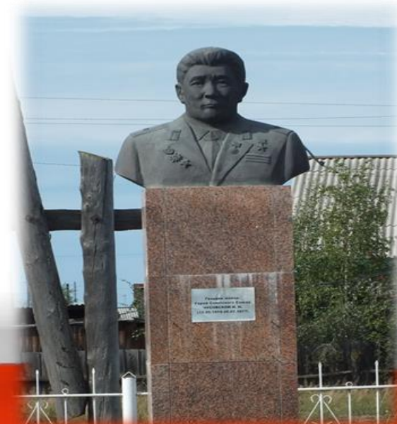
Памятник Чусовского Н.Н.