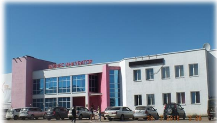
МБУ «Бизнес - инкубатор в г. Нюрба»