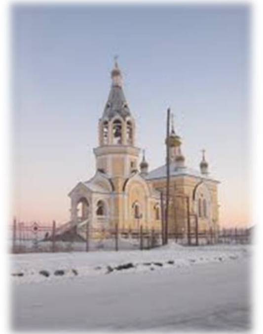
Церковь и Воскресная школа