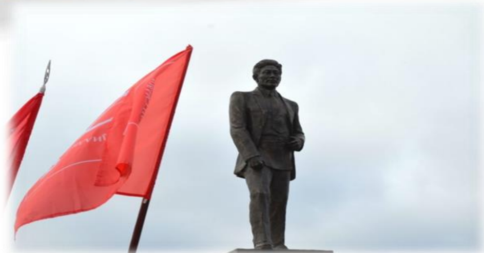
Памятник Ст. Васильева