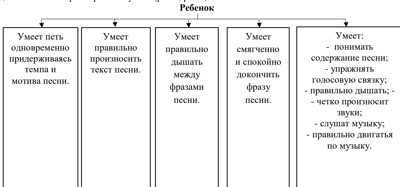
рис. 1. Модель развития вокальных умений и навыков

В результате систематических занятий развития вокальных навыков у детей старшего дошкольного возраста ребенок умеет (рис.1, рис 2):