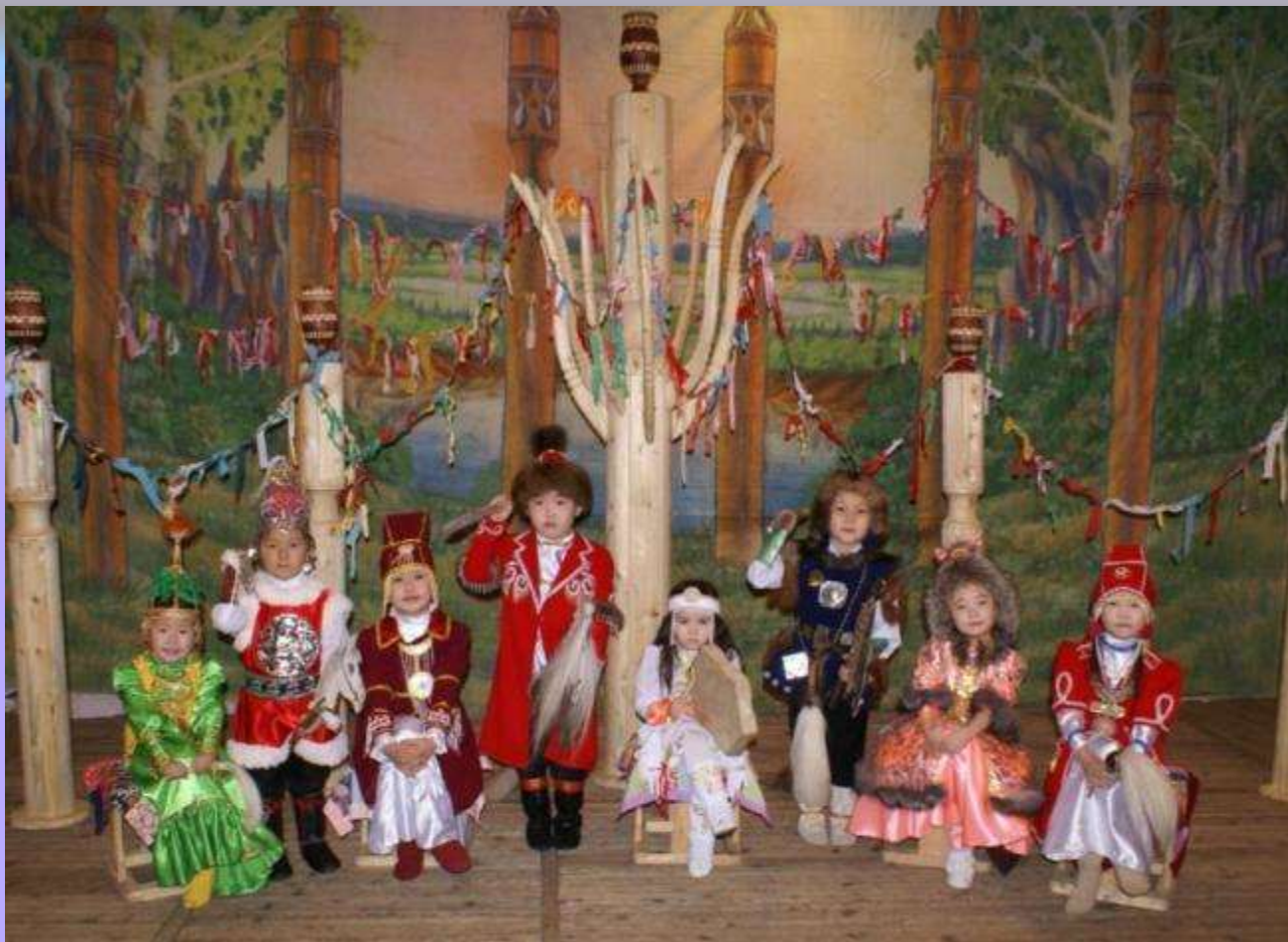
г. Вилюйск 2009г. Фольклорная группа «Лөкөй» в конкурсе «Мин олонхо дойдутун оботобун» дипломаны I степени