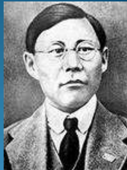
П. А. Ойунский