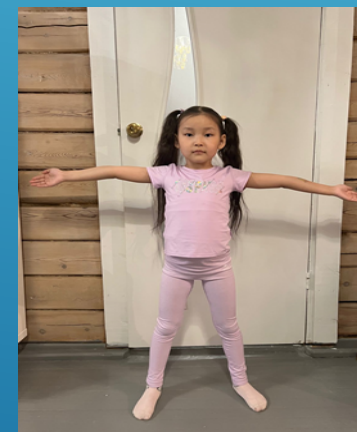
Былас (150 см)