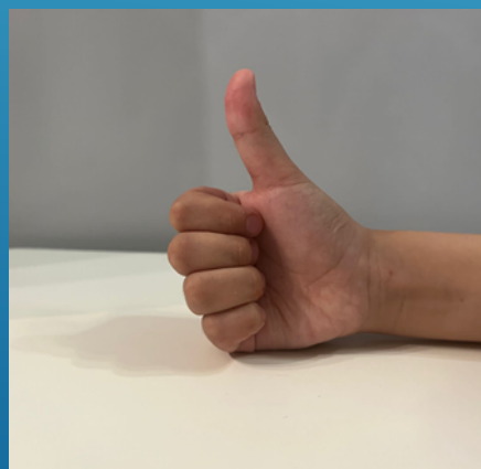
Суор холото(ортотуна н 15 см)