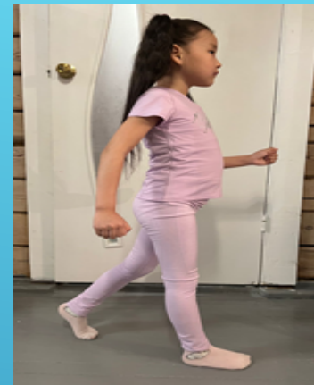
Харды (ортотунан 1 м)