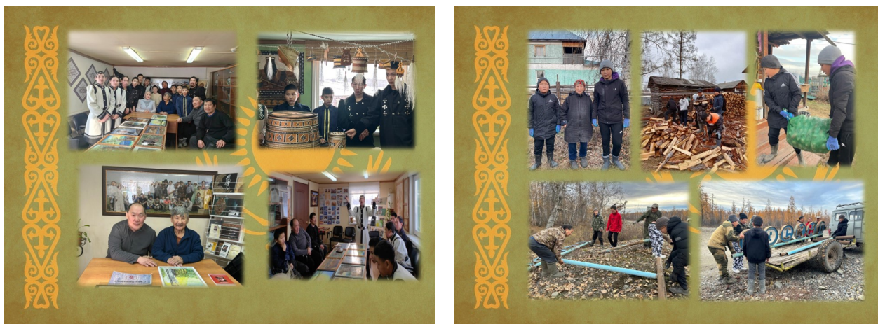
Рис. 2. Мероприятия Совета отцов “Сомо5о”

В результате реализации данного проекта в 2023-2024 учебном году активность в работе Совета отцов среди обучающихся с 1 по 11 классы возросла до 100%.