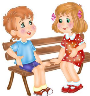
Схема – модель составления диалога по теме «Профессия»