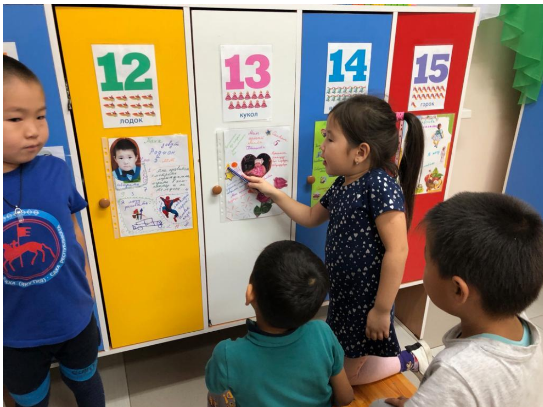
Доклад детей на тему «Я умею, я люблю...»