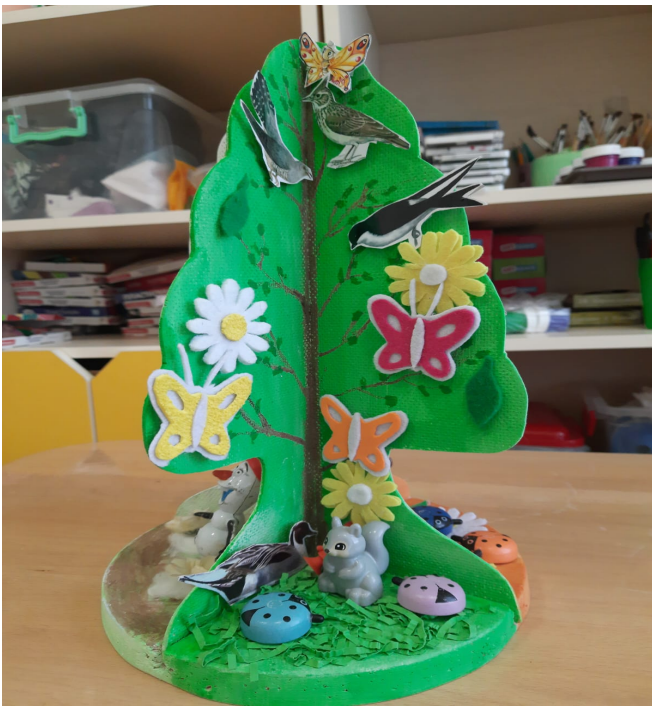
Осень (декоративное огородное-чучело, фетровые листья, овощи, птички, животные) «Сезонное дерево» готово для уголка природы в детском саду.