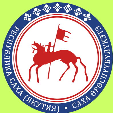
Всадник со знаменем