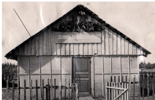
Столовая построенная родителями

В 1959-1967 г.г. благодаря начавшейся открытой разработке угля, в ЗУРе резко поднялась производительность труда. Это десятилетие когда поселок быстрыми темпами разрослся. Открыли маленькую АТС и чтобы позвонить крутили ручку без номерного телефона.