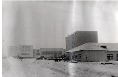
вид на новую и старую школу.

В 1958 году прилетел первый самолет. Население составляло 250 человек. На косе реки Зырянка в 1970 году расположили авиаплощадку. Летали самолеты АН-2 . Время полета до Зырянки 20 минут. Утром в 10 часов рейс улетал, в 18-00