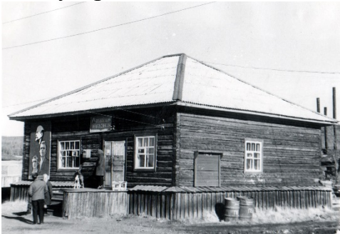
Продуктовый магазин в течении одного дня.

Все новые и новые люди приезжали, в семьях рождались дети, и поселок благоустраивался из года в год.