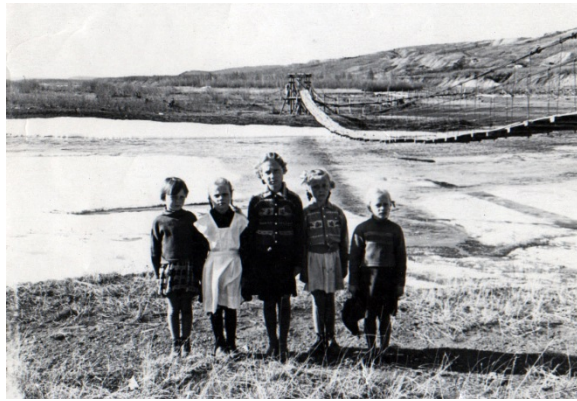
Дети 50-х и подвесной мост

Верхнеколымский наследный совет, как руководящий орган советской власти просуществовал до 1954 года, вплоть до образования отдельного Верхнеколымского района. В Верхнеколымском районе образовались сельские советы: Арылахский, Верхнеколымский, Нелемнинский, Угольнинский и Зырянский поселковый совет.