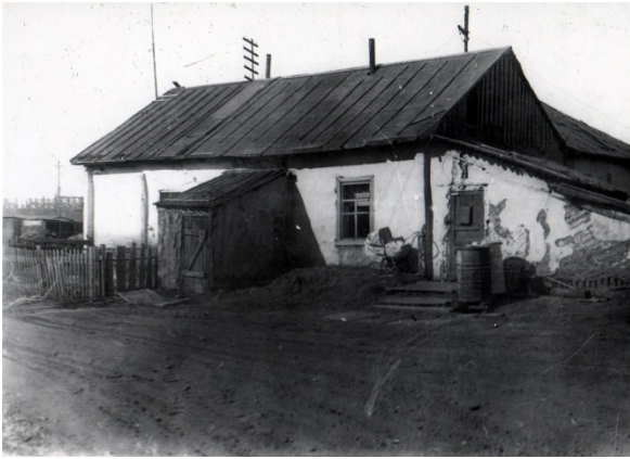
В таких бараках жили первые жители мост