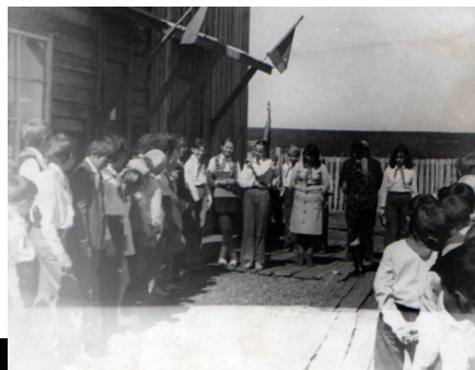
56 км, 2этажное