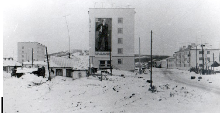
Угольное при въезде

При открытии ему присвоили ласковое имя «Малыш». На третьем этаже по проекту была игровая прогулочная веранда. Коллектив детского сада переделал её в оранжерею, и детский городок, для её оформления в 1987 г. пригласили художников – дизайнеров из г. Ленинграда. Садик был ведомственным, финансировался предприятием разреза - Зырянский. В нем были просторные групповые комнаты с новым современным оборудованием, методический кабинет с мини – музеем детского творчества. Разрез «Зырянский» постоянно закупал игрушки, развивающие игры, мебель, методическую литературу. И стал ясли – сад «Малыш» гордостью Верхнеколымского района. Строители сдали клуб на 200 мест и столовую на 10 посадочных мест. Столовая во время праздников преобразовывалась в ресторан, интерьер соответствовал духу времени. Увеличение рынков сбыта угля и повышенный спрос на Зырянские угли влекло за собой из года в год развитие транспортной инфраструктуры региона улучшение демографической ситуации. В это время строилась поселковая канализация, ввод