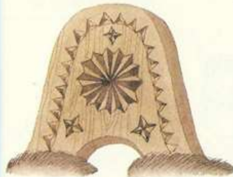
онёвүвчэ лочоко хāнин