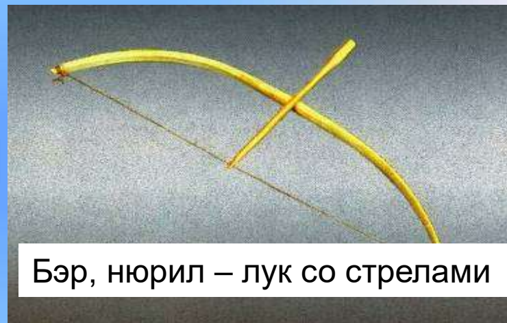
Бэр, нюрил – лук со стрелами