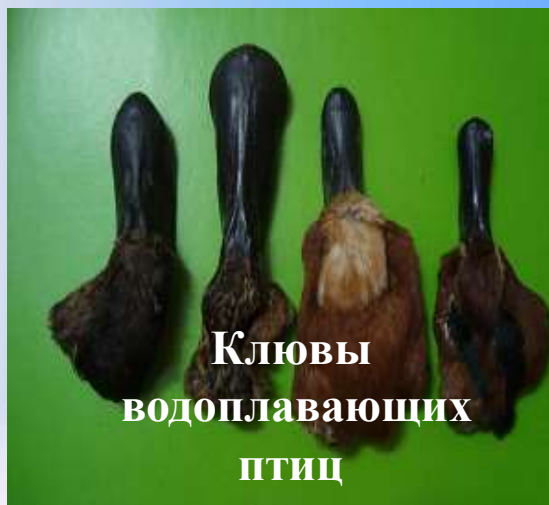
Клювы водоплавающих птиц

Эвенки, в отличие от других народов, вырезали для детей фигурки зверей, птиц, солнца, луны и поклонялись им, считая, что фигурки приносят счастье, отгоняют нечисть и оберегают хозяев от несчастий. Эвенки любили красочные игрушки.