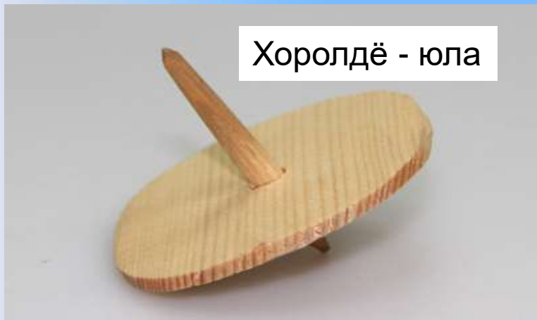
Хоролдэ - юла

Не случайно игрушки детей Севера привлекают возможностью прикосновения к уже утраченным культурным пластам. В этом и заключается актуальность данного исследования.