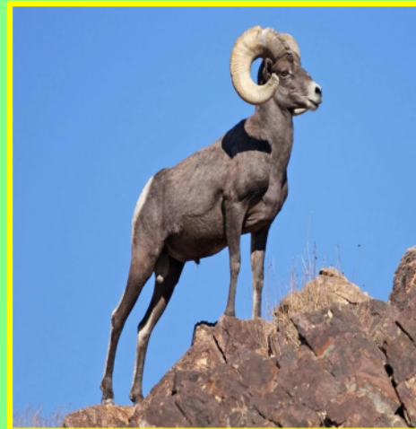
Чубуку Горный баран Уамкан