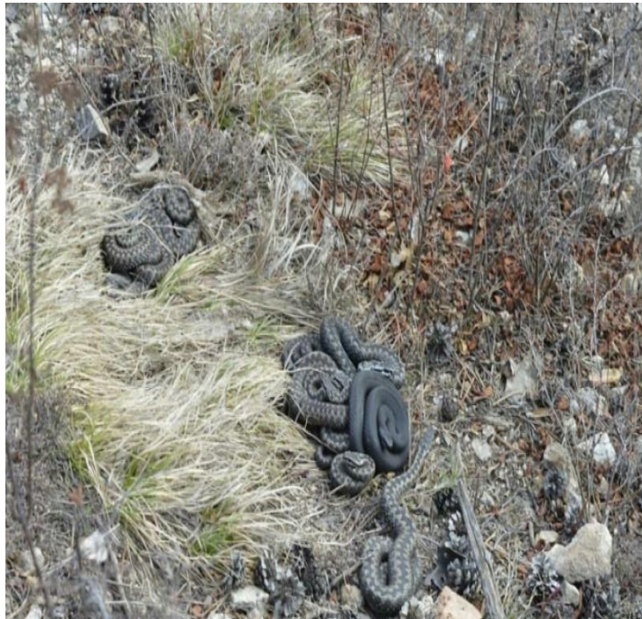
(Уруһуйу картаба сыбаа)

Сорудах: эһиэхэ бэриллибит Гадюка уһунун кээмэйдээн. Эппиэти см суруйун