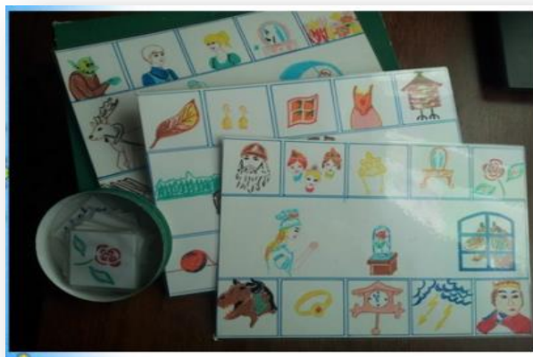
Рис. 2. Игра «Три сказки»

Игра 1. «Три сказки». Данная игра является обобщением прочитанных сказок. В основе игры использованы: русская народная сказка «Перышко Финиста – Ясна сокола», сказка С.Т. Аксакова «Аленький цветочек» и сказка зарубежного писателя Г.Х. Андерсена «Снежная королева».