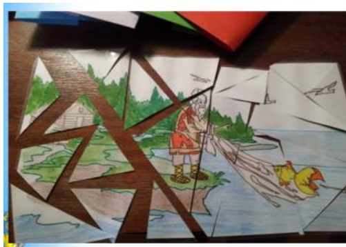
Рис. 3. Игра «Собери кусочки»

Игра 3. Лото «Простейшие фразеологизмы». Эту игру мы придумали, когда ребята начали заниматься у меня на элективном курсе «От А до Я: в мире крылатых слов». Игра состоит из 12 таблиц с краткими толкованиями фразеологизмов и 48 карточек с соответствующими им фразеологическими оборотами.