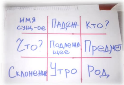
Рис. 1. Прием «Тик-тэк-тоу»

Каждый участник команды (в команде по 4 участника) берет 4 листочка бумаги. На каждом листочке участники должны записать по одному слову в соответствии с темой урока. Партнер №1 собирает карточки и выбирает любые 9 слов. Участники располагают слова в формате 3 на 3. Теперь каждый составляет по 1 предложению, используя слова на одной линии (по вертикали, горизонтали, диагонали).