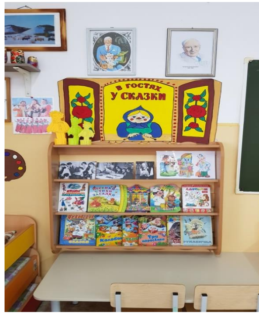
Уголок ИЗО «Рисовашки»

речевому развитию, картотека потешек, стихов, загадок, портреты детских писателей, которые мы периодически меняем. Наши малыши любят, когда мы читаем с ними книги и рассматриваем картинки.