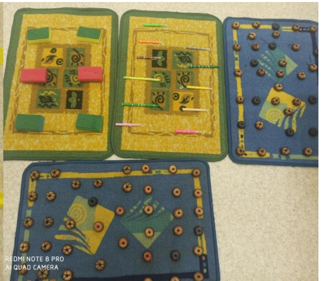
REDMI NOTE 8 PRO AI QUAD CAMERA