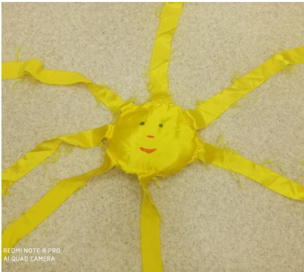
REDMI NOTE 8 PRO AI QUAD CAMERA