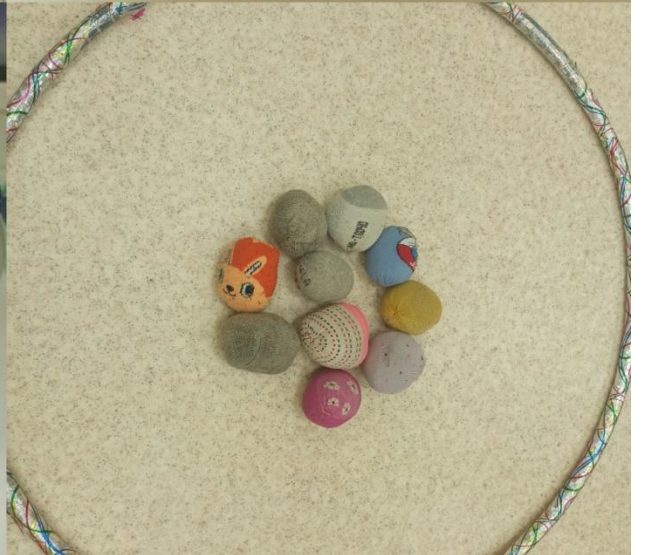
REDMI NOTE 8 PRO AI QUAD CAMERA