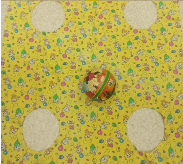
REDMI NOTE 8 PRO AI QUAD CAMERA