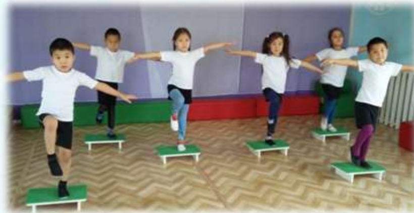
Упражнения на устойчивость, равновесие