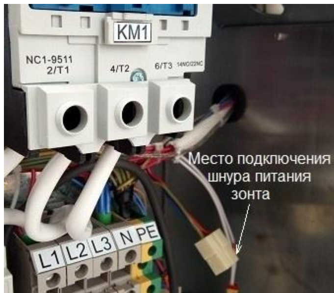
Рис.1 Подключение шнура питания зонта к колодке 45.7373.9005 пароконвектомата

Номинальное поперечное сечение шнура питания не должно быть меньше значений, указанных в таблице 3.