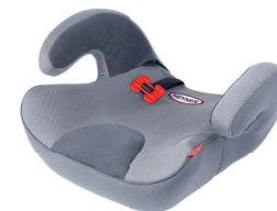
SafeUp L ERGO