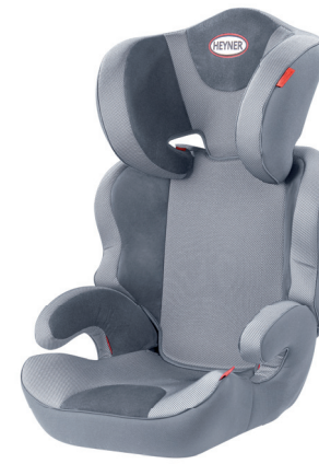
MaxiProtect ERGO SP