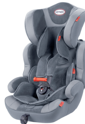
MultiProtect ERGO SP