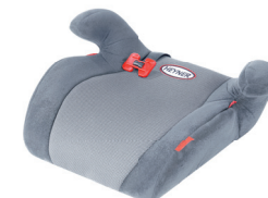
SafeUp M ERGO

In unterschiedlichen Farben erhältlich. In different colors available. Имеется в продаже разного цвета.