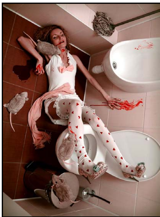
Атака гламурных крыс (2008)