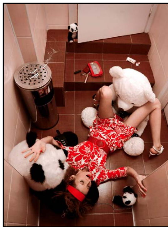
Фетишледи и медведи (2008)

"Фетишледи и Медведи" и "Атака Гламурных Крыс", на мой взгляд, скорее попадают под категорию политической сатиры, может быть Поп-Арта. Вызывают также некоторые аналогии с определёнными, так называемыми, хеппинингами представителей всё ещё достаточно современного направления, Перформенс-Арта, - таких как Пол Маккарти, например, ( не ex-beatle, Пол Маккартни, разумеется). Что касается таких произведений как "Sacrament" и "Мастер с Маргаритками" то я бы отнёс их к категории средневековых композиций, изображающих тюремные пытки и прочие страдания заключённых в период инквизиции. В данном случае инквизицию лучше воспринимать аллегорически как внутреннюю борьбу желаний с ограничениями в каждой конкретной личности и обществе её создавшем. Кстати сказать, у уже упомянутого мною Гойи есть другая серия гравюр "Капричос", в которой можно найти сплошь и рядом подобную эстетику. В них также при желании можно найти и элементы сюрреализма.