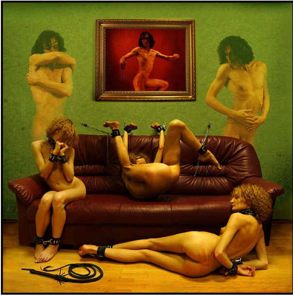
Видения Флави Нарвасадаты (2007)

может показаться, что это исключительно "господин" обладает переизбытком некой энергии, которой он беспристрастно делится с "рабом", когда тому необходимо её получить. Также как и "раб" только поначалу может представлять собой личность неспособную на самостоятельные энергетические манипуляции. Такие процессы происходят внутри каждого отдельно выбранного человека. Однако, так ли полярно противоположны эти два состояния личности? По теории, например, Большого Взрыва в астрофизике такие, совершенно по-разному ведущие себя силы, как электромагнитическая, гравитационная и силы, отвечающие за ядерные реакции, все при невероятно высокой температуре представляли собой единое целое. И не нужно быть опытным психологом, чтобы не заметить также и обратной зависимости в отношениях "господина" и "раба", делая их двумя сторонами одной монеты. "Господин" во многом рассчитывает на энергетический потенциал своего "раба", попадая, в свою очередь, в "рабскую" зависимость. Так сказать, "учитель, научи ученика, чтобы у него потом учиться". Как учит нас история, которую создаём, конечно же, мы сами, в простой подобострастной фразе "Кушать подано!" заложена энергия способная развалить не одну империю. Так чья же роль в итоге является доминирующей, "господствующей" в процессе создания общей энергетики общества? Такими вопросами нельзя не задаваться. С ними и работает Николай Седнин и как художник и как личность.