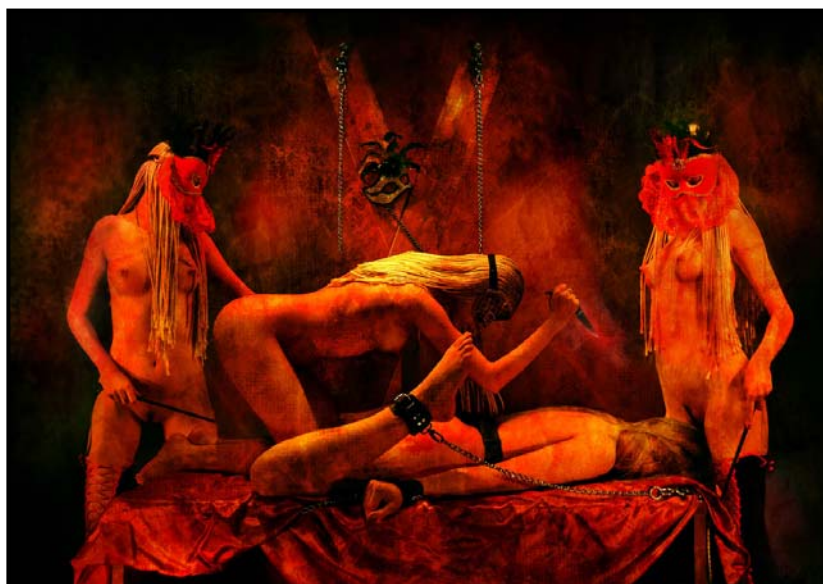
Три сестры ( 2006 )