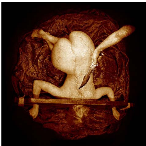
Летящая рука Мастера ( 2008 )