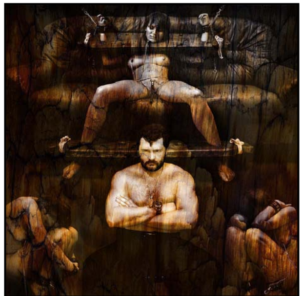
Мастер с маргаритками (2007)

ните основы законов термодинамики: вода, становясь льдом и переходя в гораздо более организованное состояние этой субстанции, отдает своё тепло в окружающую её среду и тем самым способствует повышению общего беспорядка (хаотического обмена энергией), в то время как лёд при нагревании вбирает тепло из окружающей среды, тем самым повышая процент общего порядка (более организованного обмена энергией). Отношения людей, можно сказать, та же квантовая механика. Человечество постоянно обменивается микрочастицами, и речь идёт не только о сексуальных отношениях. Любой человеческий мотив, оказывается, тоже можно разобрать до состояния элементарной частицы. Роли "господина" и "раба" постоянно меняющихся местами. Только на первый взгляд