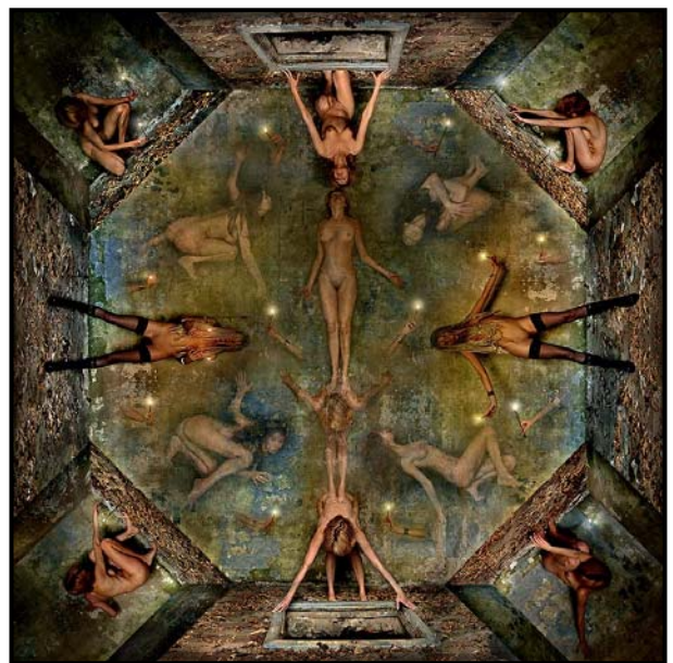
Калейдоскоп Вечности ( 2006 )

Для того, чтобы ответить на вопросы рождения чего-то нового далеко недостаточно простого критерия: красиво-некрасиво, вкусно - невкусно, понятно - непонятно, я так тоже могу - не могу. Кто сказал, что искусство и красота синонимы? Да и что такое красота - весьма относительное понятие. Равно как и любое другое понятие созданное человеком - добро, зло и т. п. Когда-то великий художник Марсель Дюшамп (дадаист, отец концептуализма), открывший невероятное количество дверей в современном искусстве, подписал