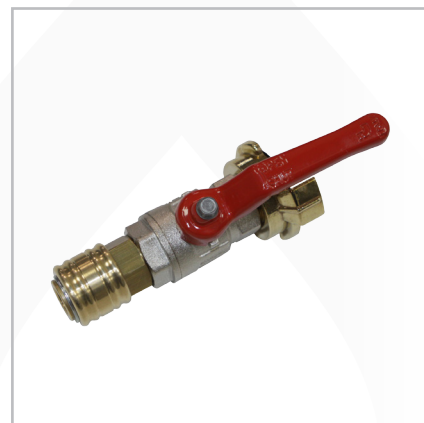
Шаровой кран с быстросъемной муфтой