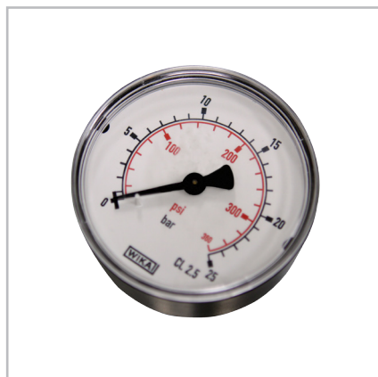
Манометр 0-25 бар.