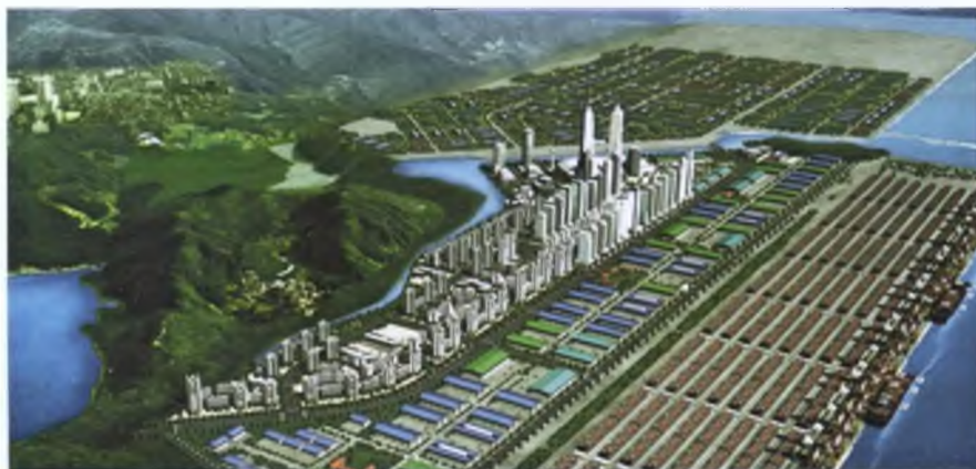
ФОТО: НОВЫЙ ПОРТ ПУСАН (BUSAN NEWPORT) ПОСЛЕ ЗАВЕРШЕНИЯ СТРОИТЕЛЬСТВА

Центр логистики занимает площадь 11 млн кв. метров и расположен в глубине прибрежной полосы порта Чинхе, который открыт для захода судов с января 2006 года. В настоящее время здесь эксплуатируется 10 причалов, строительство остальных 20-ти будет завершено к 2015 году. Выйдя на полную мощность, только новый порт Чинхе сможет перерабатывать 15 млн TEU в год. При этом из Северного порта (расположен в центре города) перевалка контейнеров будет выведена.