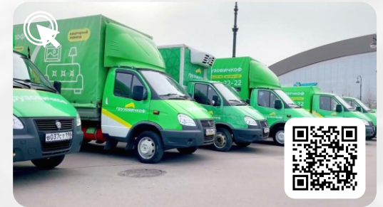
Грузовичков. Тестирование на 3 разных моторах