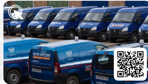
Почта России. Через 30 мин после обработки