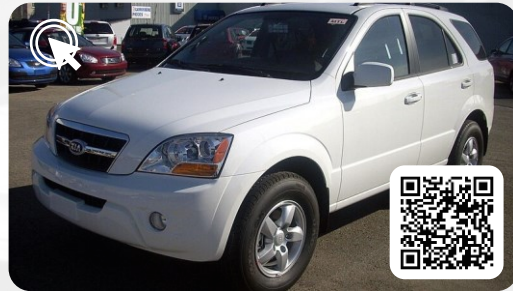
KIA Sorento - осмотр ДВС на 210 000 км