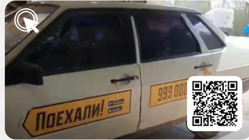
Такси - Двигатель ВАЗ 21099 МИЛЛИОННИК без капиталки