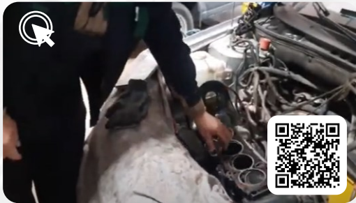
LADA Granta через 260т.км