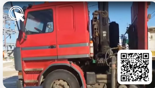
SCANIA R143. Миллионник. Хон через 30 лет