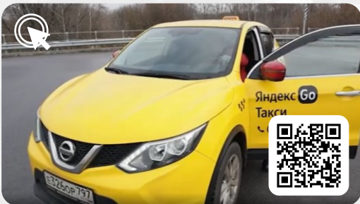
Применение в Такси. Опыт 20 лет. Интервью с чего все началось.