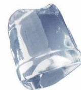
18 gr FULL ICE CUBE