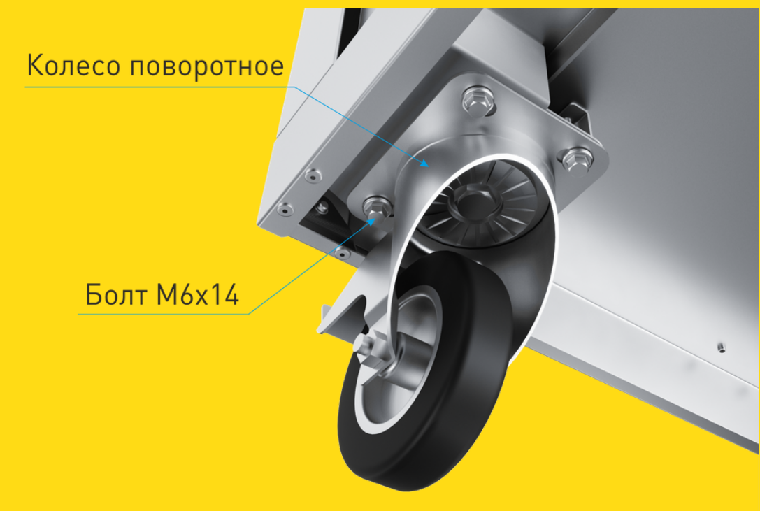
Вид снизу. Установка поворотного колеса