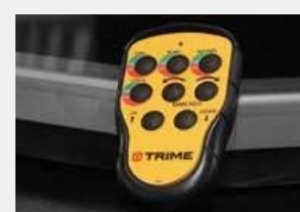
Дистанционное управление дальностью 50 м