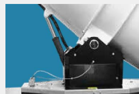
Электрическая система наклона