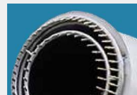
Коронки из нержавеющей стали 72 сопла