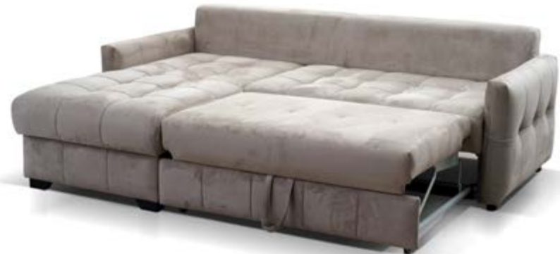
Диван с рзных ракурсов