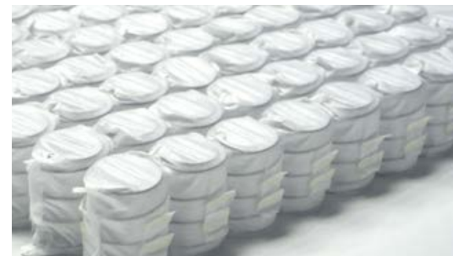
■ Независимый пружинный блок