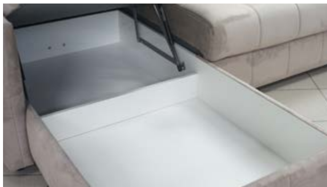
■ Короб для постельных принадлежностей из МДФ