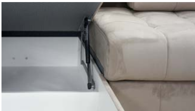
■ Механизм подъема канapé оснащен системой «газлифт»