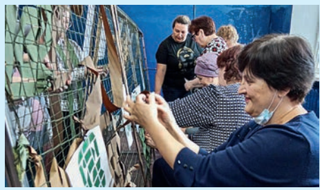
Маскировка для бойцов