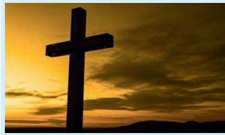
Скандал у могилы