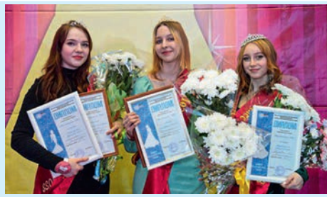
Кто на свете всех милее?