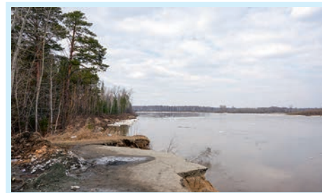
Весна не буйствует