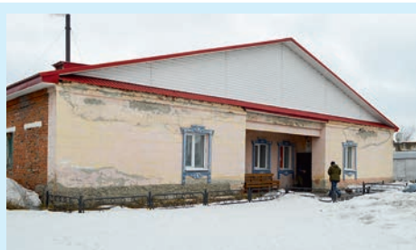
Легкий пар для души и тела