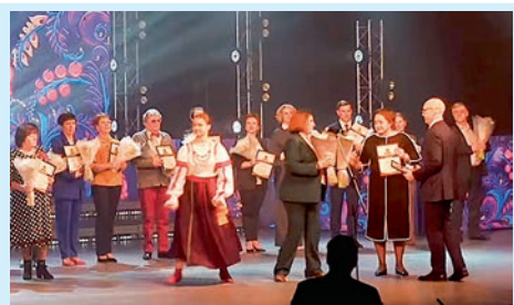
Золотая культура района