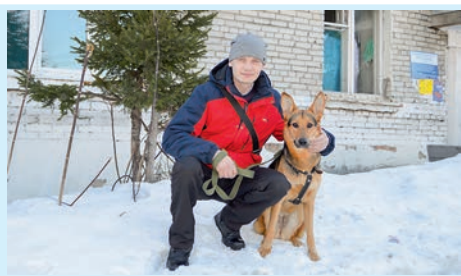
Дело следователя Чарусова