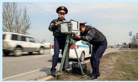
Вопреки интересам общества