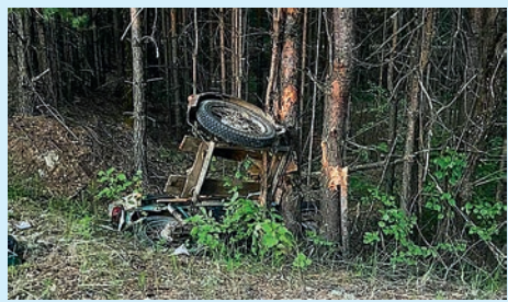
Погиб на трассе