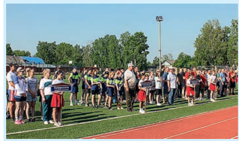
Спортивный дух и воля к победе