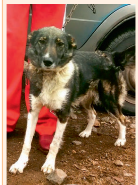
Жужа, стерилизована, небольшая, ориентирована на человека, обладает охранными качествами.