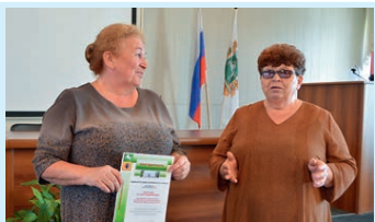
Ветераны принимают поздравления Стр. 2