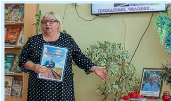
Поэты не рождаются случайно Стр. 4