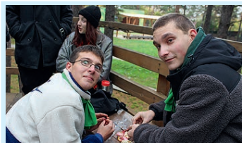
Экологический десант Стр. 5