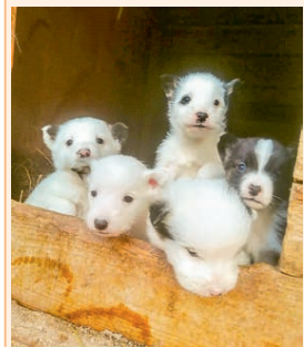
Щенки, возраст 1 месяц, вырастут средними, очень симпатичные.