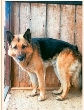
Юлдаш, верный, в меру агрессивный. Нужен опытный хозяин.