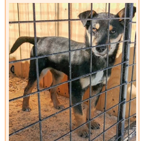
Кобель, возраст 4 мес. Отловлен на ул. Ленина, 90. Ранее был замечен на ул. Крупской.

Если вы узнали кого-то из этих собак или обладаете какой-либо информацией об их хозяевах, пожалуйста, позвоните по тел. 8-953-921-75-47.