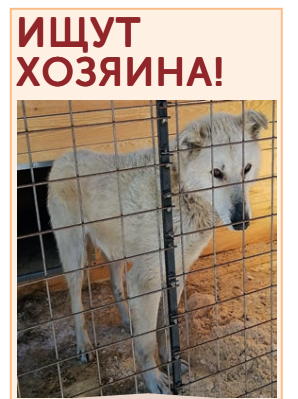
Кобель, рост выше среднего. Отловлен по адресу: ул. Тимирязева, 32. Хозяин, отзовись!