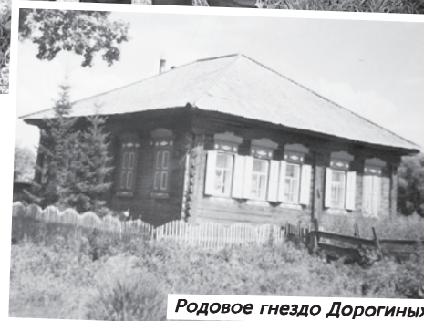
Родовое гнездо Дорогиных

Стоит отметить, что генеалогия - не только интересно, но еще и дорого. Это мужчина выяснил уже в процессе изысканий. За последние годы кратно возросло число тех, кому такая информация нужна. А раз есть спрос, то и предложения появляются. Существуют специальные сайты, которые в буквальном смысле торгуют историей. Новоявленные коммерсанты, имеющие доступ к различным архивам, монетизируют это дело. За копии документов из архивов, метрических книг, ревизских сказок и прочих материалов иногда приходится отсчитывать кругленькие суммы. Логично, что выгоднее заниматься поиском не в одиночку, а с единомыш-