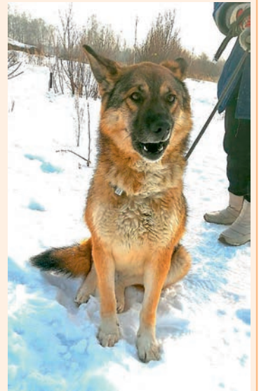
Грета, 3 года, хороший друг, любит детей, обладает сторожевыми качествами, стерилизована.

ИЩУТ ХОЗЯИНА! Если вы потеряли собаку или вам нужен четвероногий друг и охранник, звоните в Центр передержки собак по тел. 8-953-921-75-47.