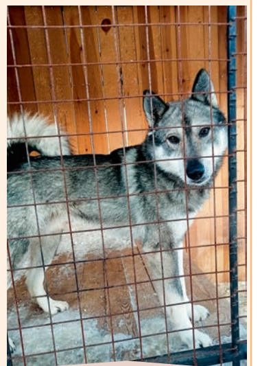
Мальчик, фенотип лайки. Ему нужен серьезный, уверенный в себе хозяин, ведущий активный образ жизни.