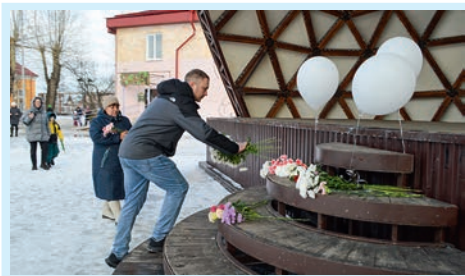
Полетели в небо журавли...