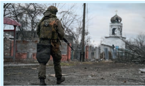
Трагическое эхо Авдеевки