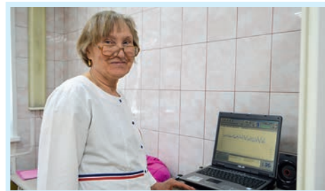
Наблюдая за рождением жизни