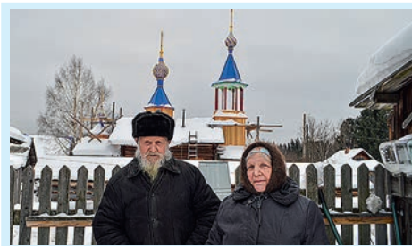
В гостях у старообрядцев Стр. 4-5