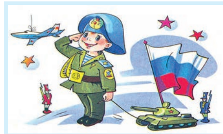
О защитниках замолвите слово Стр. 7