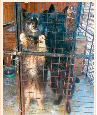
Торпеда и Ракета, два веселых черных облака. Крупные, возраст 10 месяцев.