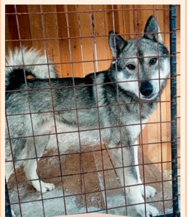
Мальчик, фенотип лайки. Ему нужен серьезный, уверенный в себе хозяин, ведущий активный образ жизни.