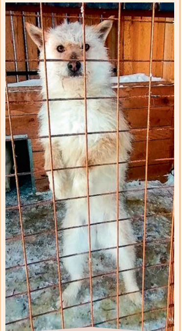
Девочка, кличка Ежик, возраст 1 год, небольшая, обладает сторожевыми качествами.