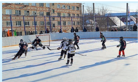
Спортивное будущее района Стр. 3