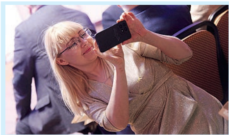
Асиновские медиа рулят! Стр. 2